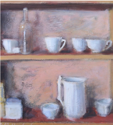
Gammel Hylle, Forsand 50x40 cm