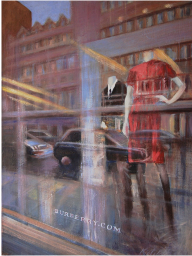
Burberry, Bond Street, London 80x60 cm